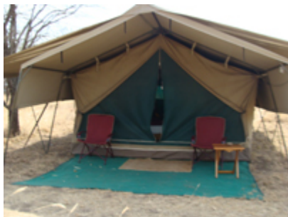
Middag och övernattnig på Serengeti Wilderness Camp.

I Serengeti finns många olika rovdjursarter såsom lejon, leopard, gepard, hyena, schakal, krokodil med mera.